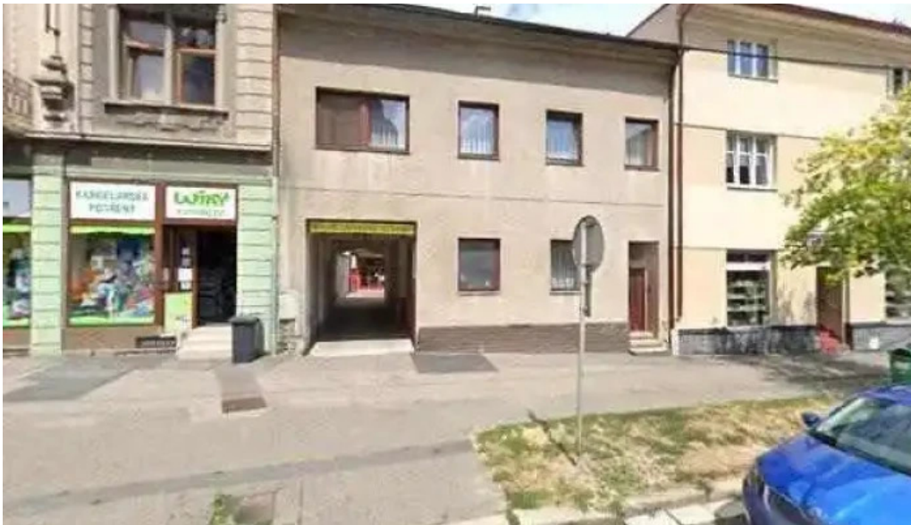
Vespa expres food street view a 360deg