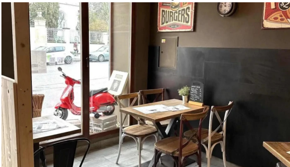
Vespa expres food vzhled a atmosfera