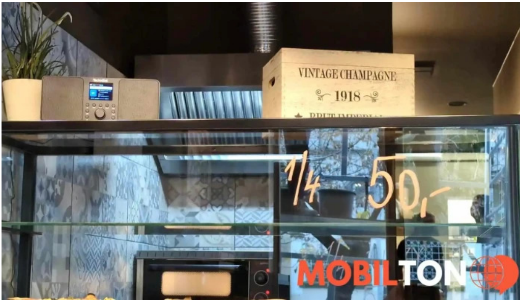
Vespa expres food videa