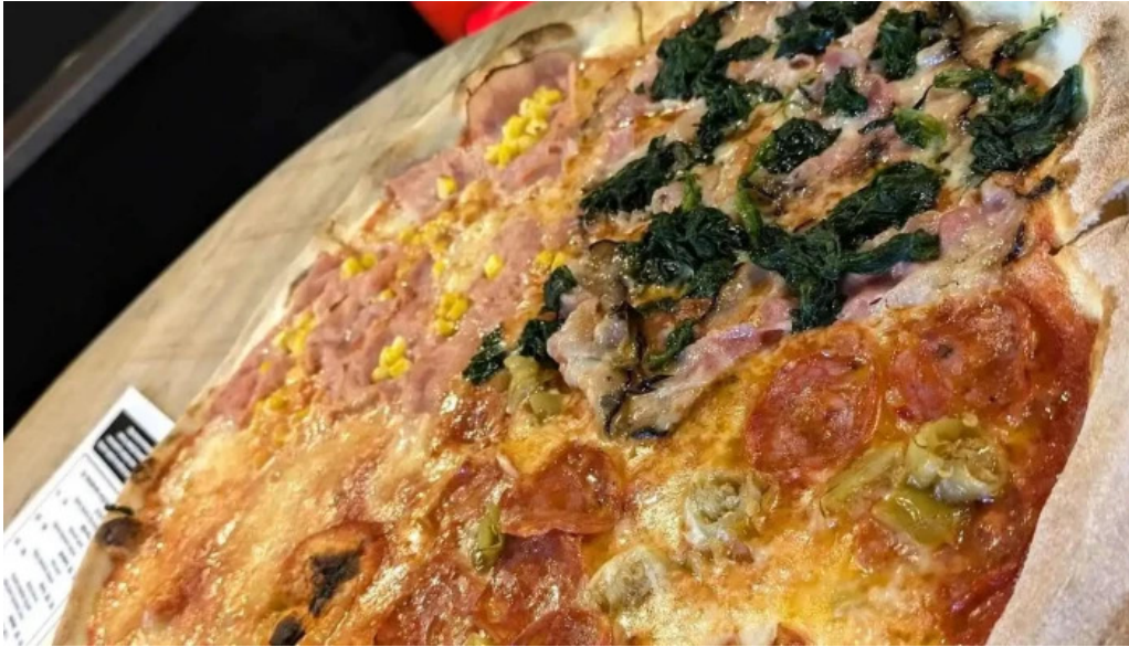
Vespa expres food vse