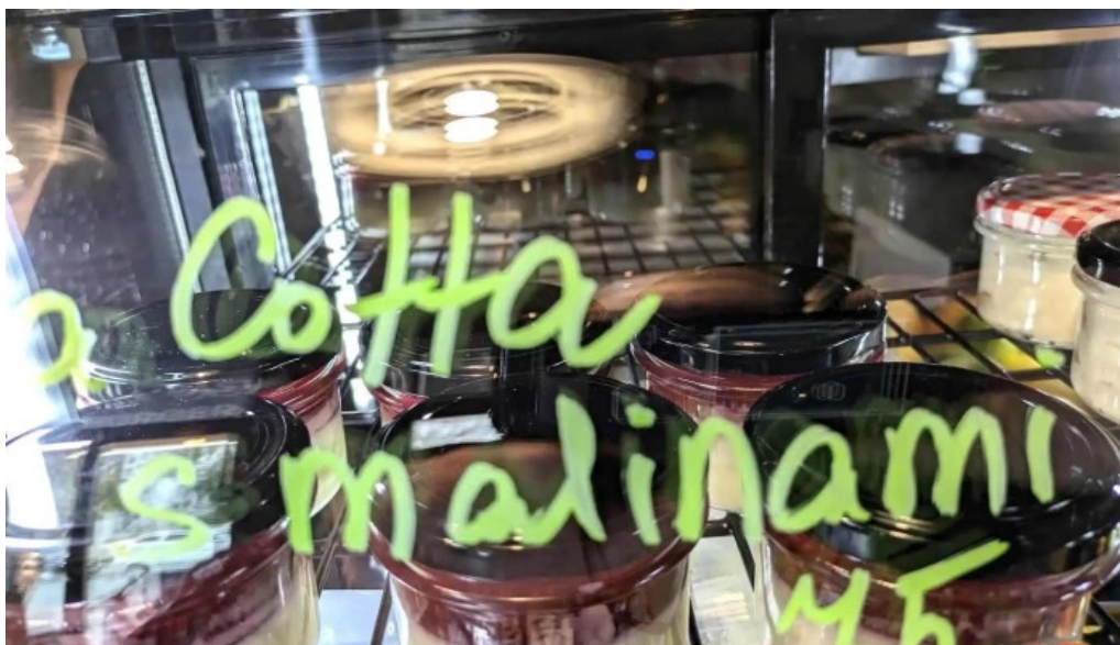
Vespa expres food comfort food