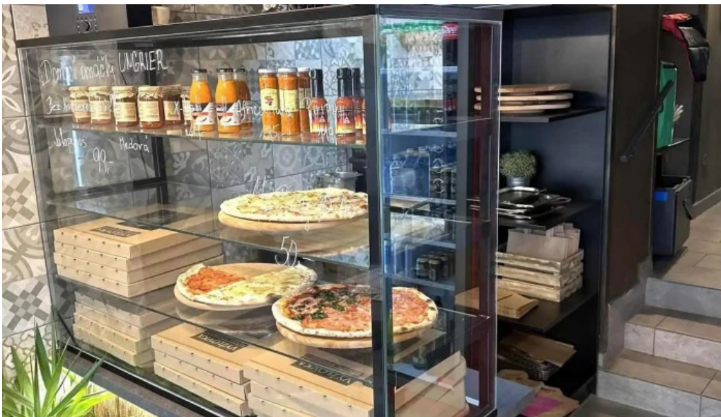
Vespa expres food najnovejsi