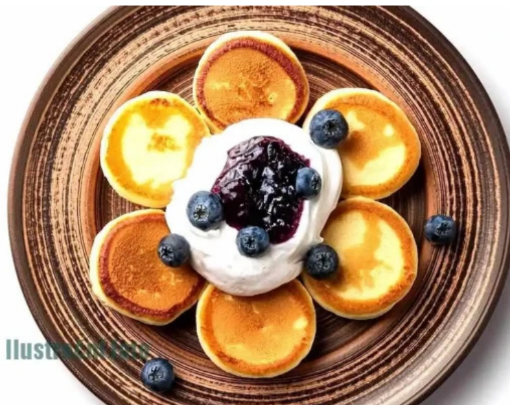
Vespa expres food kolin iv